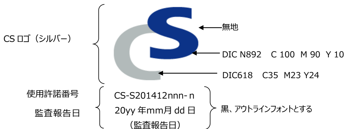
図1 CSシルバーマークの構成図